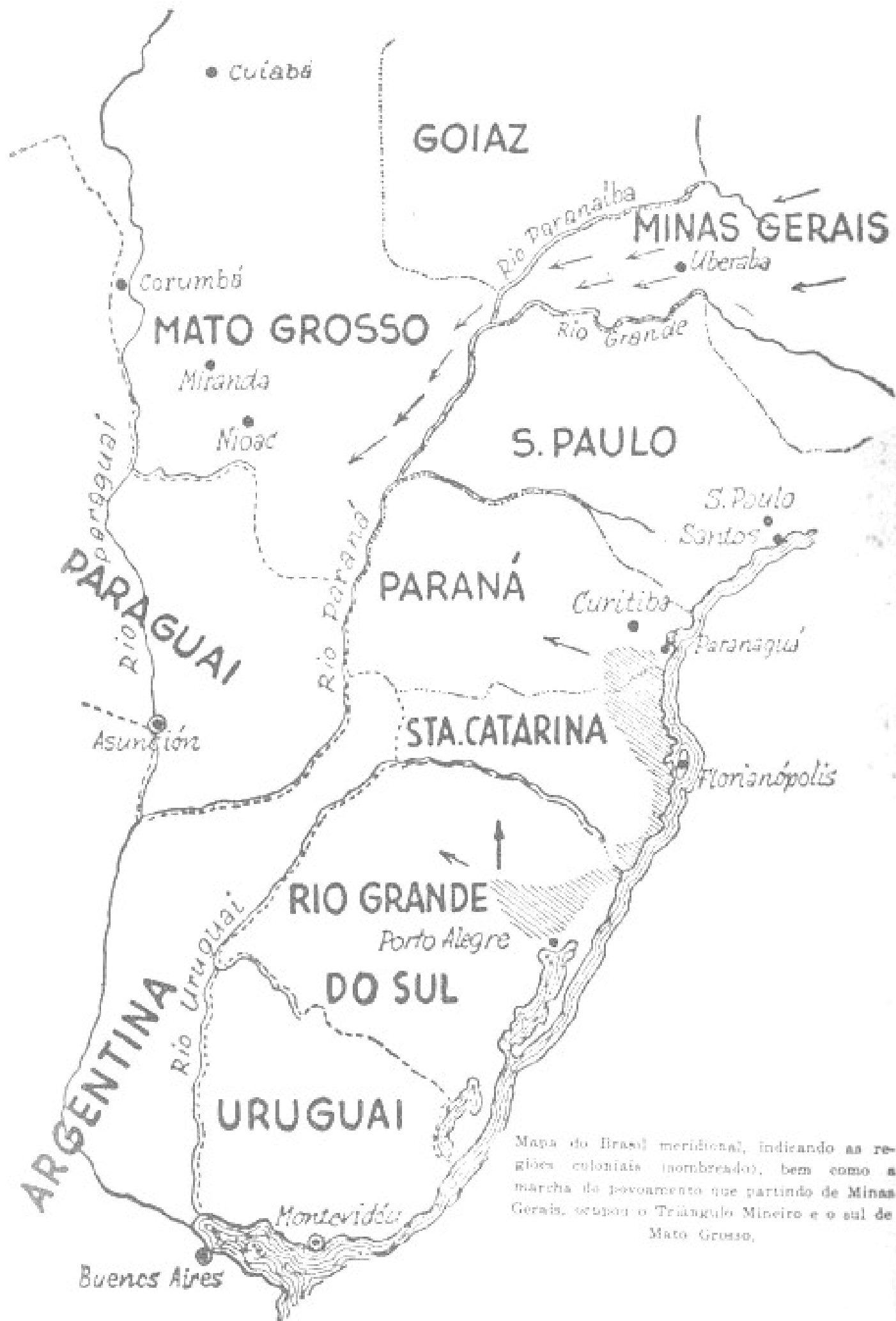
Mapa do Brasil meridional, indicando as regiões coloniais (nomeadas), bem como a marcha da povoamento que partindo de Minas Gerais, seçou o Triângulo Mineiro e o sul de Mato Grosso.